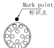
view K K向孔位排列