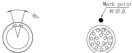
Socket front view 插座前视图